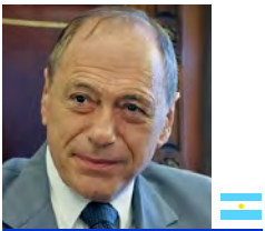
Eugenio Raúl Zaffaroni