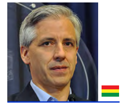
Alvaro García Linera