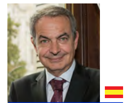
José Luís Zapatero